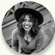
Briani Columbia English & History