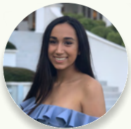
Octavia Harvard Economics